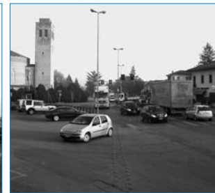
Incrocio a Ponte della Priula