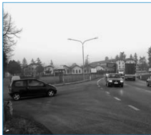
Incrocio SS. 13 con Via Barca

Tre interventi molto attesi per dare scorrevolezza al traffico tra Susegana e Ponte della Priula, ma anche per abbattere l'inquinamento dovuto alle code di veicoli