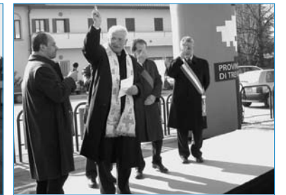
La benedizione dei lavori

Il 16 febbraio è stato avviato il cantiere per la realizzazione delle rotatorie di Susegana e Ponte della Priula sulla Statale Pontebbana. Il 16 febbraio è stato avviato anche il cantiere per realizzare uno svincolo a livelli sfalsati sempre sulla Pontebbana in località Stradonelli. Tre opere indispensabili alla "vecchia" Statale 13 per evitare di arrivare al collasso a causa del crescente numero di veicoli che quotidianamente la percorrono e per far crescere ancora un po' la qualità del vivere nel Comune di Susegana.