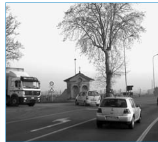
Incrocio SS. 13 con Via Stradonelli