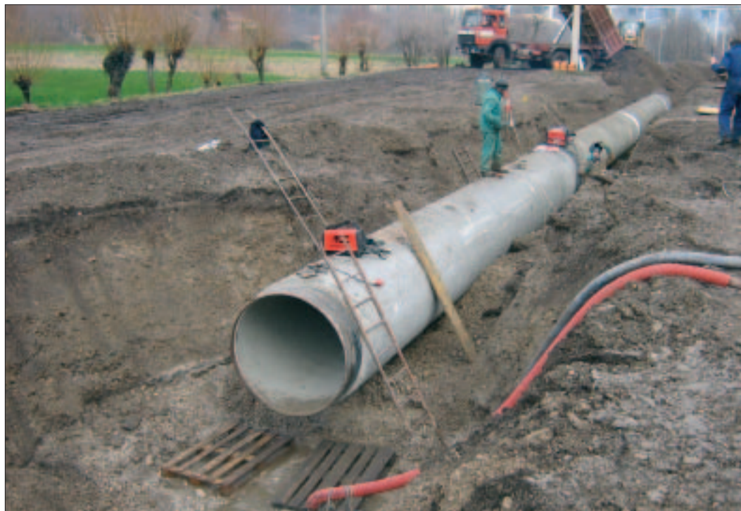
Operazioni di saldatura e reinterro delle tubature idriche.

La gestione pubblica dell'acqua è al centro dell'attenzione e di una raccolta firme nelle piazze del nostro territorio